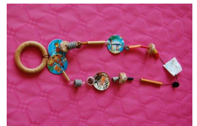
Exemples de bijoux réalisés par des enfants de 6 – 7 ans