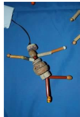
Personnages réalisés par des enfants de 7 - 8 ans