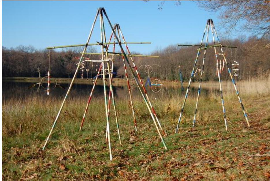
L'installation pour présenter les modèles de mobiles

Dans les deux cas, le but étant avec des matériaux simples, de permettre à l'enfant de percevoir et de comprendre les notions d'équilibre et de mouvement propres aux mobiles. L'enfant repart bien sûr avec son œuvre.